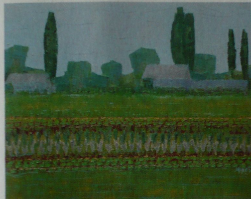
François Murez, La Baratte, un jardin de la Loire , 2006, huile sur toile, La Galerie Jardin, Paris, du 3 au 28 mars.

Le parcours de François Murez a commencé aux beaux-arts de Toulouse avec l'apprentissage du dessin, à la fin des années 1970. À Toulon, lors d'un travail d'équipe, il découvre la sculpture, et poursuit l'expérience à Paris. Depuis les années 1980, Murez travaille dans son propre atelier en région parisienne. Ses peintures s'organisent autour de thématiques en lien avec les voyages, des paysages où la nature lance, dans sa beauté fragilisée, un appel que le peintre entend et retranscrit en matières colorées. Ses sculptures sont autant de tentatives de redonner vie aux bois abandonnés – tronçonnés, flottés... – possédant encore une capacité d'évocation, que la gouge du sculpteur peut libérer. Plusieurs de ses récentes expositions se sont inscrites dans une démarche