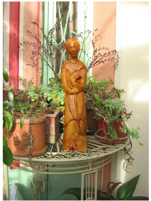
Saint-Fiacre, Sculpture du tricentenaire François Murez